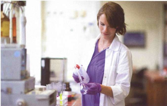
Doktorandin an der Universität

Nach Abschluss meiner Doktorarbeit möchte ich weiter forschend tätig sein. Dafür stehen viele Wege offen. Pharmazeutische Unternehmen bieten interessante Karrieremöglichkeiten. Auch ein Auslandsaufenthalt an einer Universität oder einem Forschungszentrum ist eine herausfordernde Alternative, die auch zu einer wissenschaftlichen Laufbahn an der Universität führen kann.