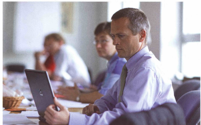
Fachapotheker für Pharmazeutische Technologie

Wer sich als Apotheker für eine Tätigkeit in der Pharmazeutischen Industrie entscheidet, dem steht eine sehr abwechslungsreiche Karriere offen – fundierte Fachkenntnisse, Belastbarkeit und Neugier vorausgesetzt.