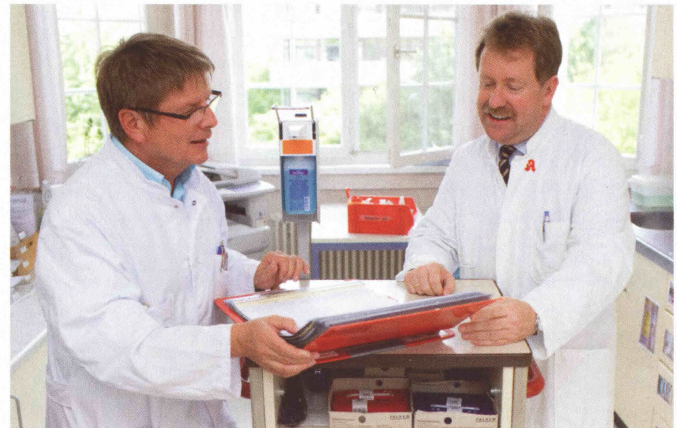
Fachapotheker für Klinische Pharmazie

Die Überwachung der Arzneimittellogistik und die Herstellung von Arzneimitteln wie Chemotherapeutika für Krebspatienten ist ebenfalls Teil meines abwechslungsreichen Aufgabengebiets. Es gehört zu meinen täglichen Aufgaben als Krankenhausapotheker, an der Visite teilzunehmen, also der Kontakt mit den Patienten direkt am Krankenbett sowie Anfragen von Ärzten und Pflegepersonal zu Arzneimittel-, Neben- und Wechselwirkungen zu bearbeiten und zu dokumentieren. Als Experte für Arzneimittel leiste ich im Krankenhaus zusammen mit Ärzten und Pflegepersonal einen großen Beitrag zur optimalen Betreuung der Patienten.